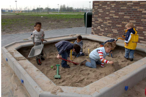
De gemeente maakt een zandbak in de nieuwe wijk

En zorgen dat er een zandbak is waar mensen elkaar kunnen ontmoeten.