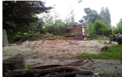
Bewoners van Tuin In De Stad in Groningen bouwen eigen zandbak

Professionele grensconflicten over inhoud (“is dit de goede richting?”) of domein (“welke sector is verantwoordelijk?”) vervallen omdat de grenzen en ambitie van het initiatief leidend zijn.